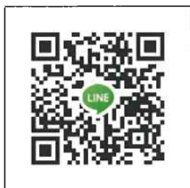
留学相談用 Line QR