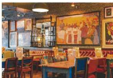
キャンパス周辺のパブ