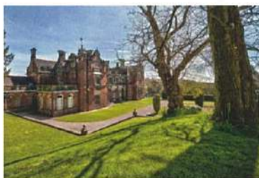
キール大学キャンパス