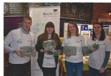
キール大学SDGs活動サークル