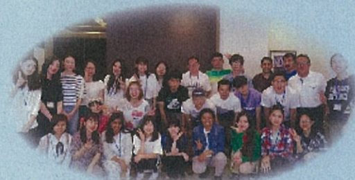
2019年度 奨学生産見高研修会にて(2018年度・2019年度財団奨学生) (2020年度 奨学生研修会は新型コロナウイルスにより中止になりました。)

【応募資格】 アジア諸国の国籍を持つ私費留学生 (該当国は当財団ホームページをご参照ください)