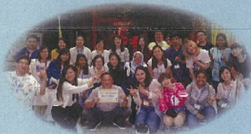
2018年度 奨学生産見高研修会にて(2017年度・2018年度財団奨学生)

《注意》学校種別で1名のみでの申請となります。奨学金種別は当財団で決定いたします。