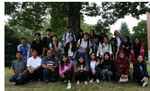
2017-2018 year J Program students