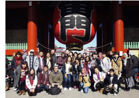
留学生実地研修旅行(東京)

年に1回、留学生と日本人学生合同で、近隣県の研修旅行(1泊2日)を予定している。その他、日本美術の一環で、東京や千葉、県内の美術館等への日帰り見学を定期的に行う。