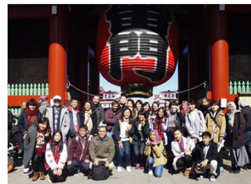
International Students' Study Visit (Tokyo)

We will have an Excursion for International and Japanese students in the Gunma region, which runs for two days with an overnight stay. As part of Practical Study of Japanese Painting, we also have a day trip to museums in Tokyo, Chiba and within Gunma.