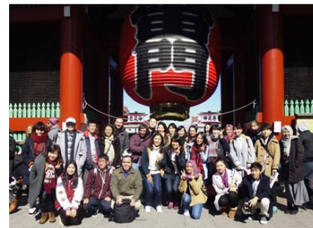
留学生実地研修旅行(東京)

年に1回、留学生と日本人学生合同で、近隣県の研修旅行(1泊2日)を予定している。その他、日本美術の一環で、東京や千葉、県内の美術館等への日帰り見学を定期的に行う。