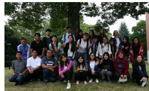
2017-2018 year J Program students