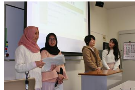
Presentation of J Program Students