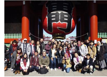
International Students' Study Visit (Tokyo)

We will have an Excursion for International and Japanese students in the Gunma region, which runs for two days with an overnight stay. As part of Practical Study of Japanese Painting, we also have a day trip to museums in Tokyo, Chiba and within Gunma.