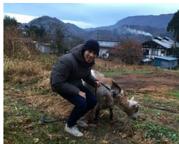
インターナショナルキャンプ